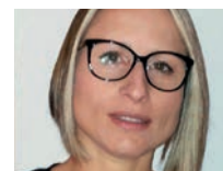
** Educatrice presso il Centro Socio Educativo Il Melograno, laureanda in Scienze dell’educazione presso l’Università di Verona.