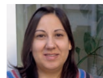
* Educatrice presso il Centro Socio Educativo Il Melograno, laureata in Psicologia Clinica e Dinamica presso l’università La Sapienza.